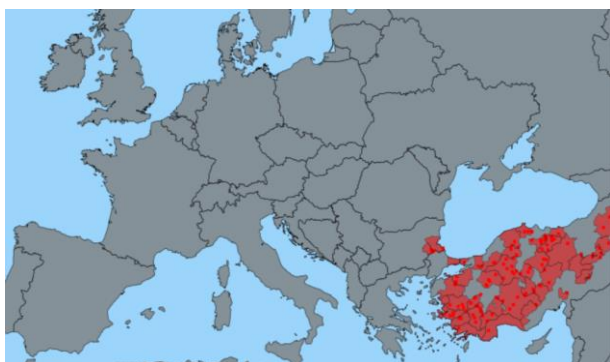
Карта 1: Ситуация в ЕС и съседни трети страни

Към настоящия момент България е със статут на несвободна от чума по дребните преживни животни страна. Болестта не е разпространена в други съседни страни, нито в държави членки на ЕС.