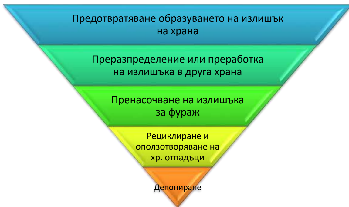
Фигура 1: Йерархия за използване на храни 8

Произведени хранителни продукти, които не могат да бъдат продадени или реализирани, но са безопасни и могат да се използват за производство на други храни или да се преразпределят за консумация от хора и така остават в хранителната верига, не се считат за хранителни отпадъци (например, преработка на непродадени, но безопасни за консумация хлебни изделия в галета или даряването им за консумация от хора в нужда).