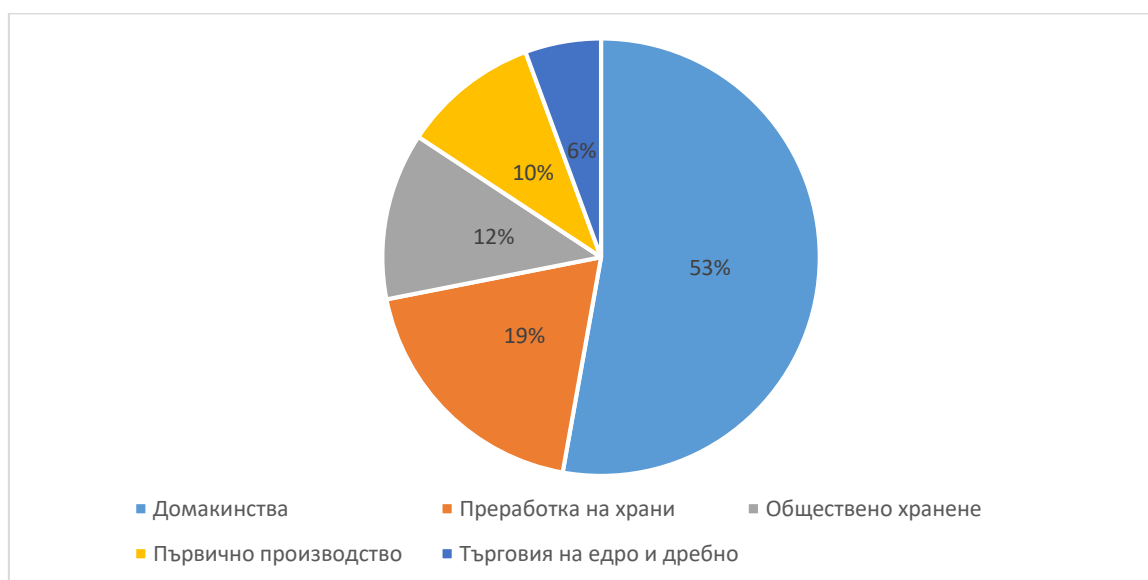
Фигура 2: Етапи на хранителната верига, допринасящи за генериране на загуба и разхищение на храни в ЕС

Храните се губят и разхищават по цялата хранителна верига. Данните и оценките от проекта FUSIONS 15 (Фигура 2) показват, че в ЕС етапите с най-голяма степен на загуби и разхищение на храни, са домакинствата с 53% и преработвателната промишленост с 19%, като секторът на хранителните услуги е с 12%, първичното производство с 10%, а търговията на едро и дребно с 6%.